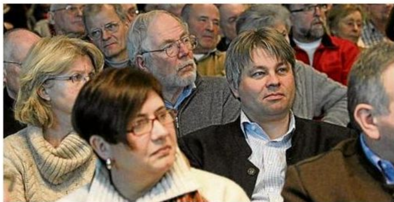
Zumindest im vorderen Bereich gut besetzt: Knapp 350 Besucher informierten sich in der Loisachhalle über den Planungsstand in Sachen S-Bahn-Verlängerung.