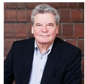
Kandidat fürs Bundespräsidentenamt: Joachim Gauck.

Der Rücktritt des bisherigen Bundespräsidenten Horst Köhler hat uns alle zum Handeln gezwungen. Die FW-Landtagsfraktion hat am Dienstag, den 8. Juni 2010, noch einmal ausführlich das Für und Wider eines eigenen Kandidaten für die Bundespräsidentenwahl diskutiert. Nachdem kurz nach dem Rücktritt von Horst Köhler und der wirren Kandidatendiskussion von Union und SPD in der Fraktion noch eher die Meinung überwog, selbst jemanden aufzustellen, hat sich mit der Benennung von Joachim Gauck die Stimmung zur Kandidatenfrage gedreht. Mit Gauck ist ein überparteilicher Kandidat nominiert, der bei den Freien Wählern und auch in der Öffentlichkeit gut ankommt. Aufgrund dieser Basismeinung hat die Fraktion mehrheitlich beschlossen, keinen eigenen Kandidaten zu benennen. Es wird voraussichtlich in nächster Zeit noch ein Kennenlerngespräch mit Joachim Gauck stattfinden. In der nächsten Landesvorstandssitzung wird das Thema Bundespräsidentenwahl nochmal besprochen werden.